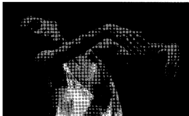
(O Estado de S. Paulo. 1/07/2009. C2. D4)

Dança – teatro é sinônimo desta coreógrafa que dirigiu o Tanztheater Wuppertal e criou obras como "Café Muller" e "Sagração da Primavera" consideradas obras-primas da dança do século XX.